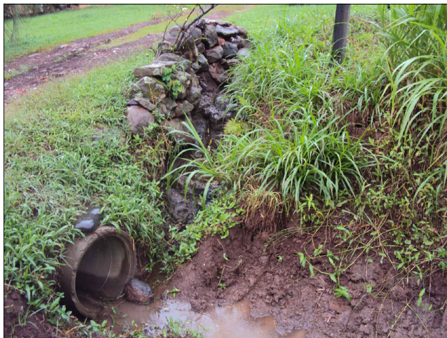
Montante, detalhe do cano a ser removido e local a ser executada a CX2.